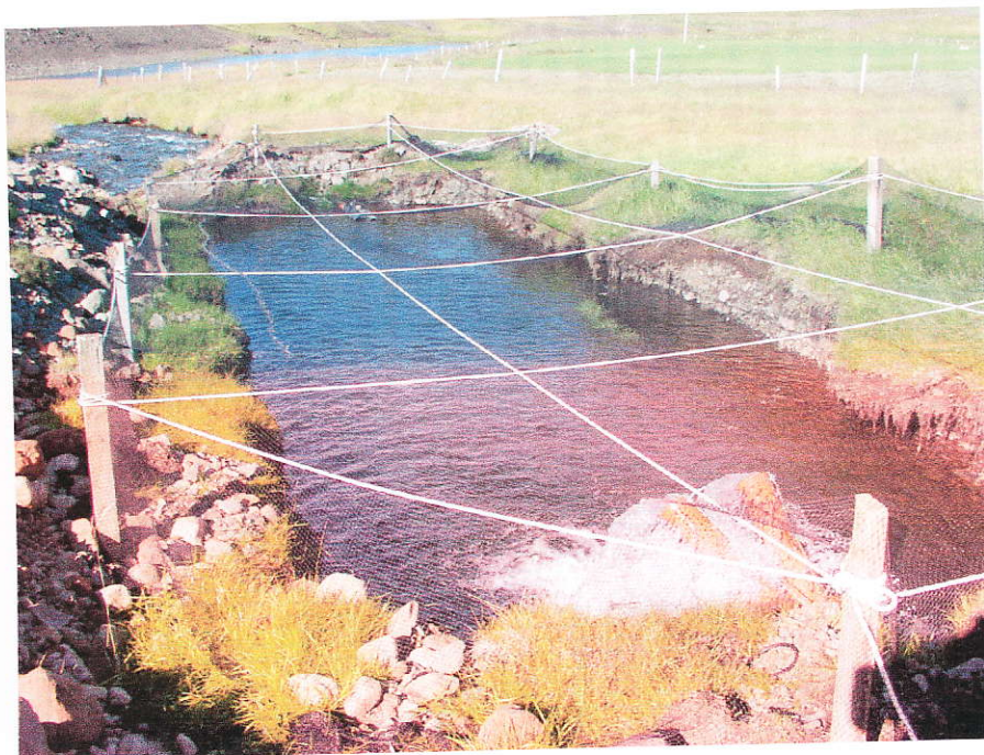
Mynd 2. Sleppitjörn við Prándargil í Laxá sumarið 2002.