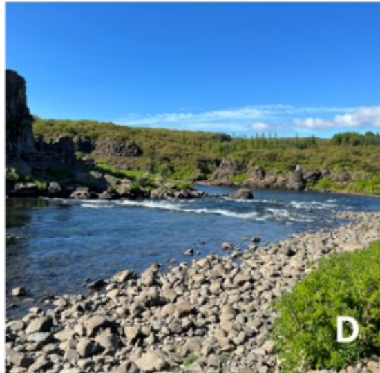
Mynd 1. Sýnatökustöðvar í Elliðaám (A+B) og Norðurá (C+D) sumarið 2022.