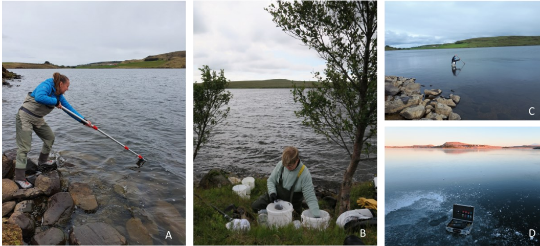
Mynd 2. Sýnataka í Eystra Gíslholtvatni. A) Blaðgrænumælir mundaður í júní 2022, B og C) söfnun hryggleysingja og mæling á blaðgrænu í ágúst 2022, D) mælingar á leiðni og pH í gegnum tæran ís í desember 2022.