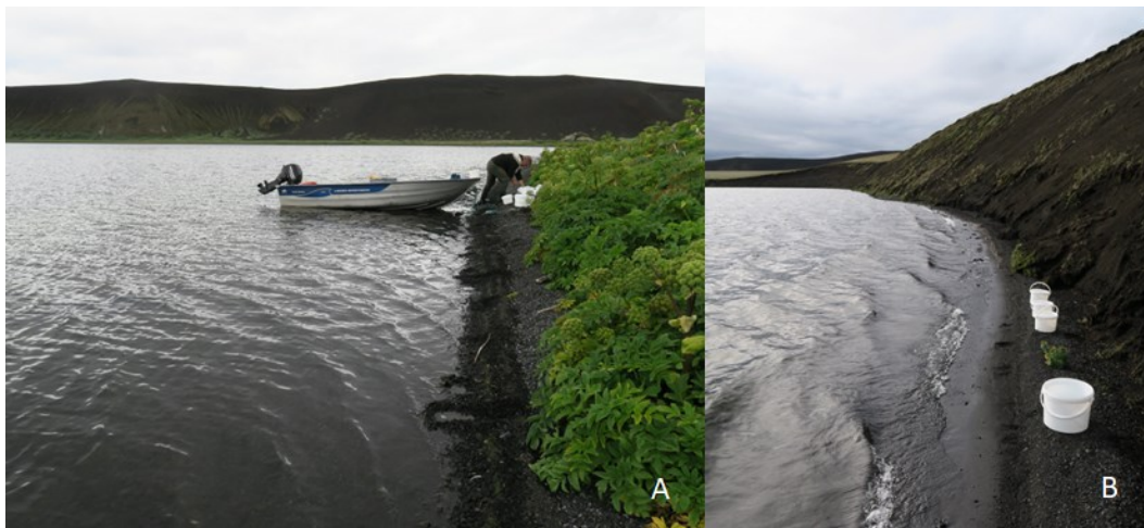
Mynd 3. Sýnataka í Stóra Fossvatni í júlí 2022. A) Söfnunarferð undirbúin, B) söfnun hryggleysingja í fjöru.