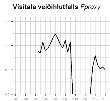
Rækja Ísafjarðardjúp. Afli, vísitala veiðistofns og vísitala veiðihlutfalls. Northern shrimp Ísafjarðardjúp. Catches, fishable biomass indices and F_{proxy} .